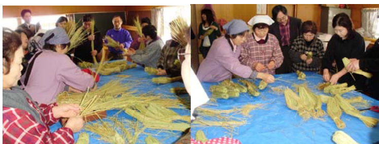
「藁つと」づくりの様子

西和賀エコミュージアム推進事業では、長瀬野生活研究グループのみなさんから納豆づくりについて学び、「藁つと」作りを体験しながら、昼食には保存食を利用した西和賀ならではの郷土料理を満喫できるプレツアーを実施しました。