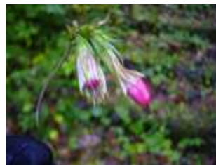
金山跡も見てきました