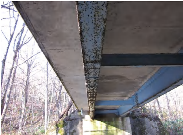
鋼橋 主桁 腐食