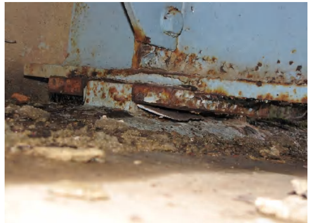
鋼橋 支承 腐食