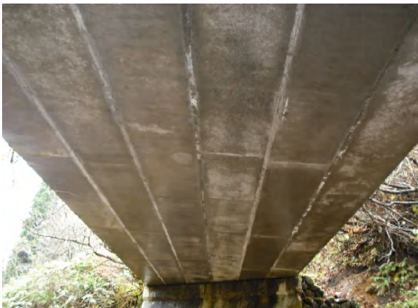
PC橋 主桁 ひびわれ