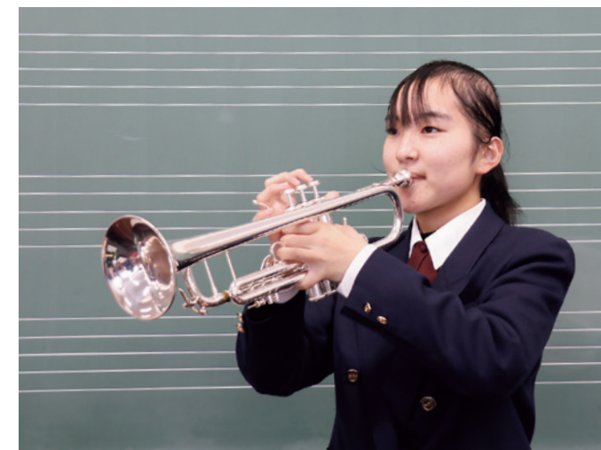
小学3年から続けている吹奏楽では、さまざまな楽器を経験したり演奏できるのでとても楽しいです

授業で地域の人たちや企業と交流することが多く、とても楽しくすてきな時間だと感じます。幼児や小・中学生とも交流したいし、地域の人といつでも気軽に会話できることが魅力です。