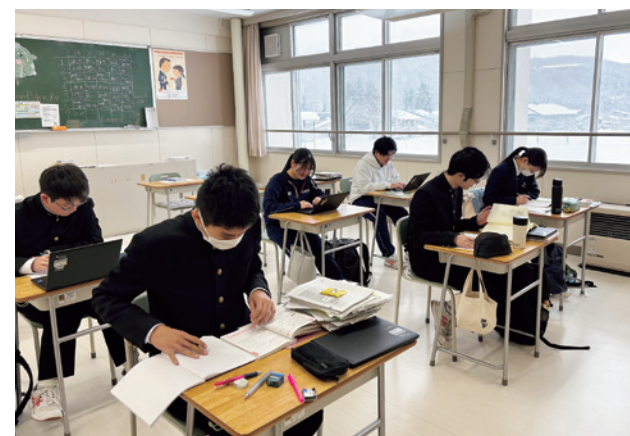
冬休み中の教室で自主学習に取り組む進学クラスの3年生