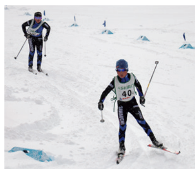
小学男子リレーで互いに競い合う沢内ジュニアスポ少の選手たち