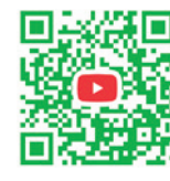
西和賀高校 PR 部 YouTube チャンネル