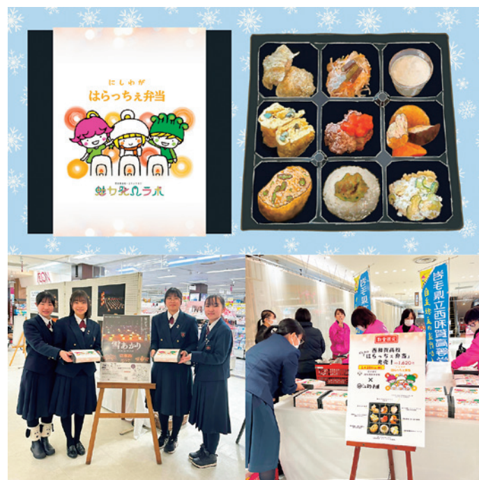
江釣子ショッピングセンター PALで「はらっちえ弁当」を販売した西高2年生4人と西和賀商工会女性部の皆さん