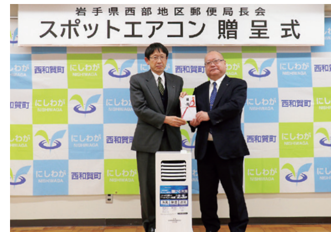
贈呈されたスポットエアコンとともに目録を手にする内記町長と阿部会長

阿部会長は「夏の災害発生時に避難所となる施設にエアコンが必要になってきている。地域の安全安心の確保に役立ててほしい」と願っていました。