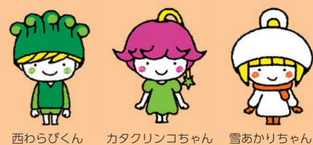
西わらびくん カタクリンコちゃん 雪あかりちゃん