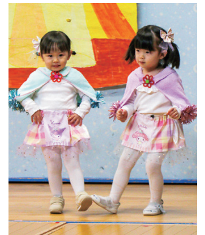
湯本保育園生活発表会