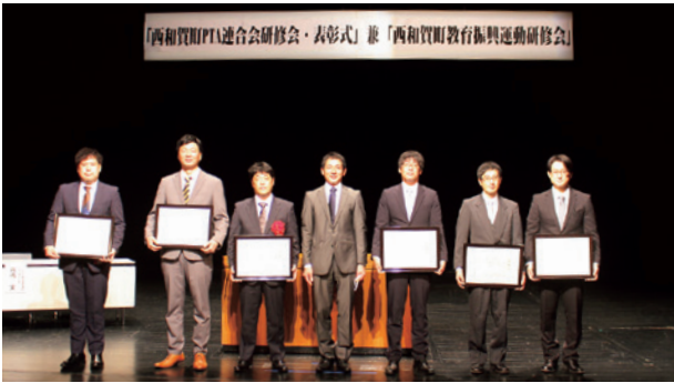
表彰式に出席された表彰者の皆さん