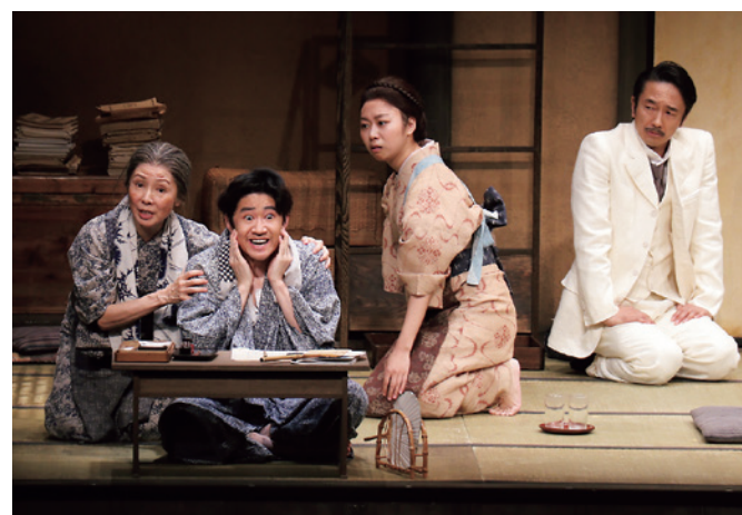
奥行きある舞台と俳優陣の演技力で観客を魅了するこまつ座