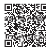
高校公認 X (旧 Twitter)