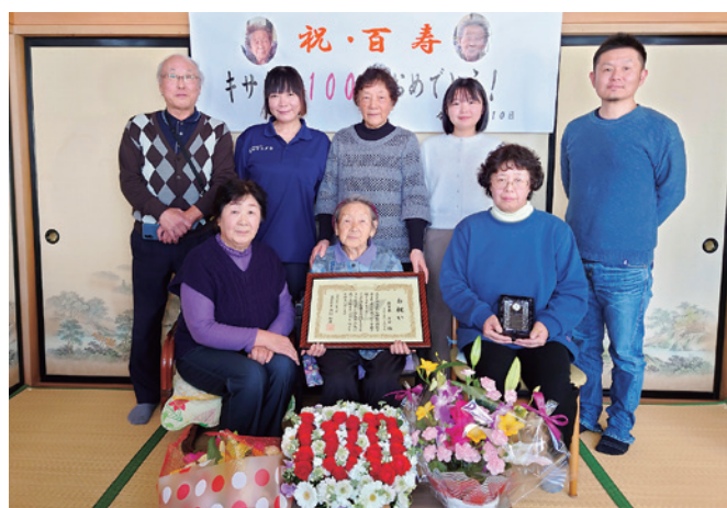
家族や親族に囲まれて記念撮影をするキサさん

キサさんは「肉も魚も何でもよく食べて、畑仕事をしたり散歩をすることが長寿の秘訣。まだまだ気持ちは 80 代よ」と笑顔を見せていました。