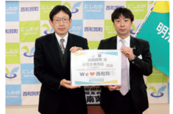
不安解消と経済支援の一部になることを願い目録が渡されました

村尾支社長は「地域活性化のための具体的な取り組みを進め、問題を発展させないための予防として、さまざまな角度から支援していきたい」と力を込めていました。