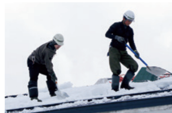
除雪作業を行うときは安全対策をして2人以上での作業を心掛けましょう