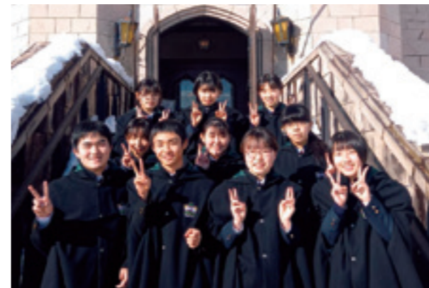
研修に参加し充実した表情を見せる生徒たち

1年生3人と2年生7人は1月8日～11日、福島県天栄村にあるブリティッシュヒルズで語学研修を行いました。期間中は日常会話から英語を使い、現地の雰囲気を楽しみました。