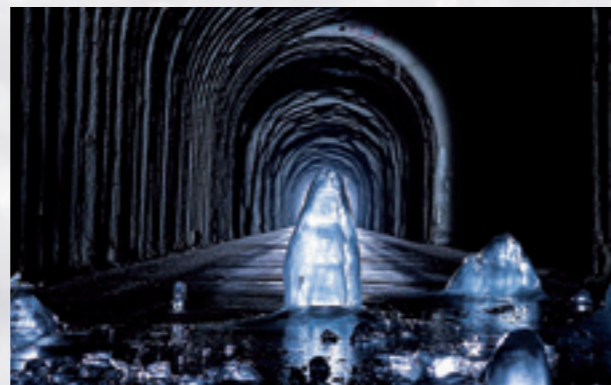
雪の反射が幻想的な景色を作り出す大荒沢トンネル