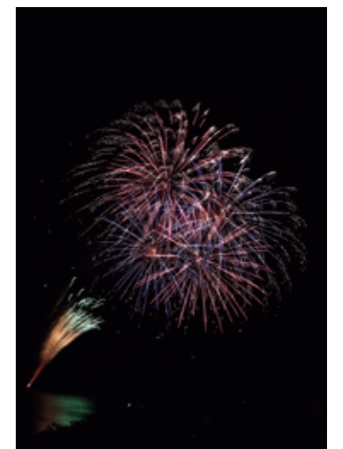
湖水まつりの花火