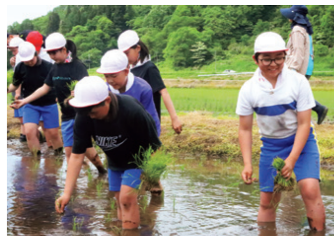
泥んこになりながらも楽しそうに手植えをする児童たち