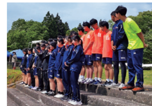
大会で使用した錦秋湖に感謝する生徒たち