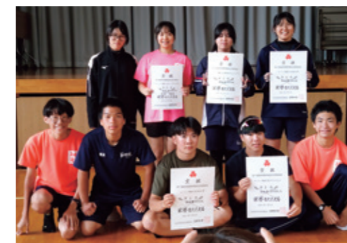
賞状を手に笑顔の3年生