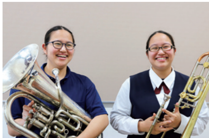
姉妹でコンクールに向け部活動を頑張っています