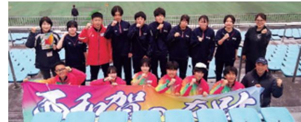
健闘をみせた陸上部の部員たち