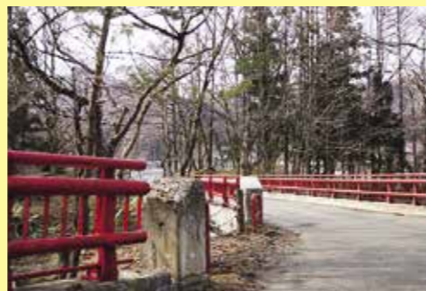
光が差して赤い欄干がきれいに見えたので撮りました