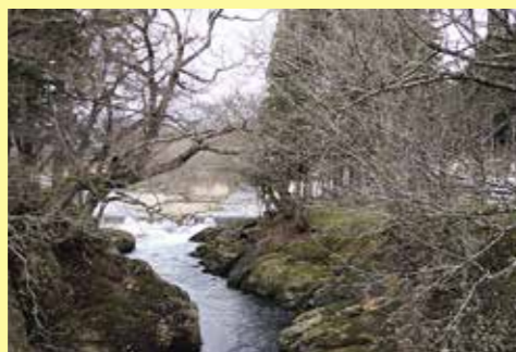
自然が作り出した景色がきれいだったので撮りました