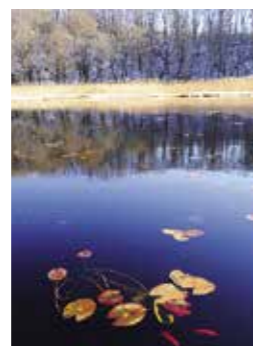
(左) 弁天島に広がる星空 (右) 湯川沼の輝く湖面