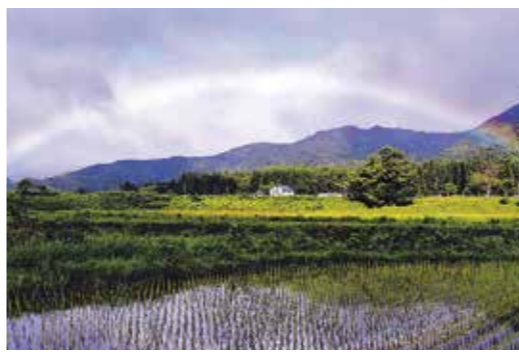
朝に草刈りをしていると虹が架かっていました。急いで家からカメラを持ち出し撮影