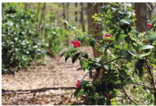
野々宿の秀衡街道に咲く雪ツバキ