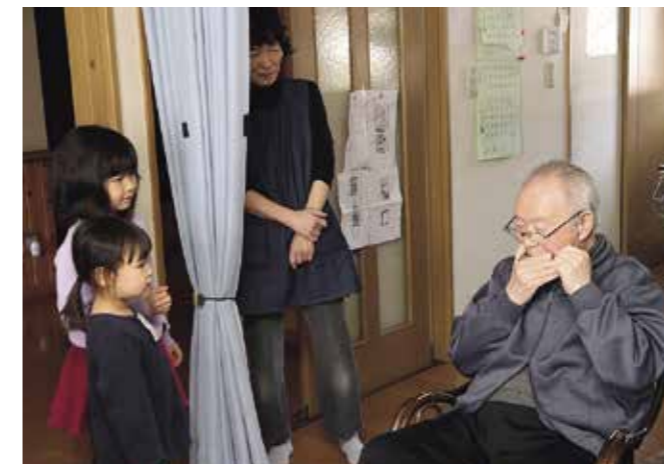
ハーモニカ演奏を披露する定雄さん（右）