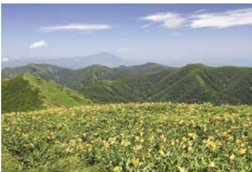
和賀岳に咲くニコウキスゲ。奥には岩手山が見える