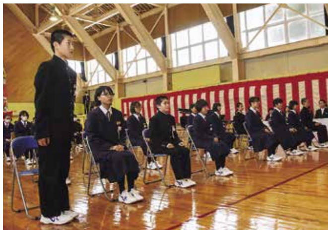
堂々と返事をする新入生