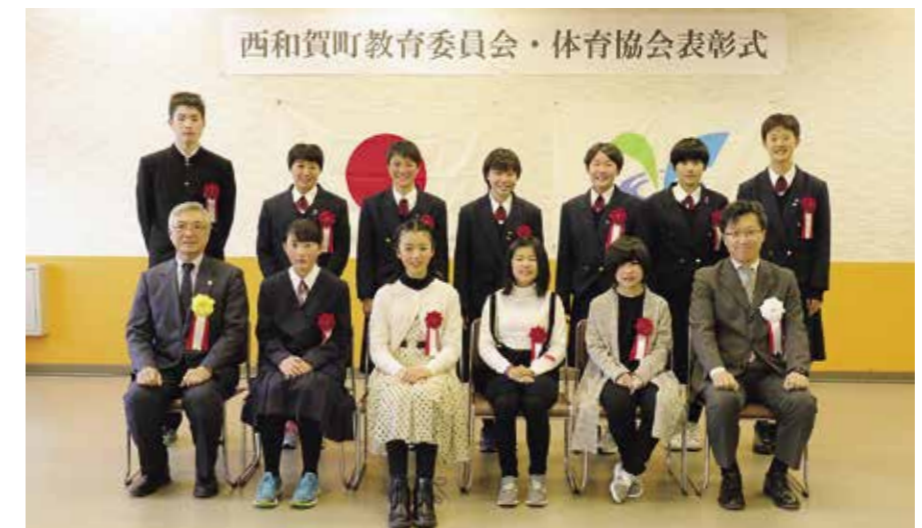
教育委員会表彰を受賞した皆さん

令和元年度の教育委員会表彰・体育協会表彰式が3月24日、太田老人福祉センターで開かれました。受賞者を紹介します（敬称略、所属・学校名・学年は表彰式時点です）。