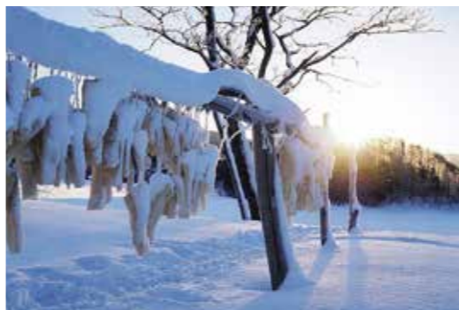
近所の凍み大根に朝日が差し込んでいる瞬間を撮影