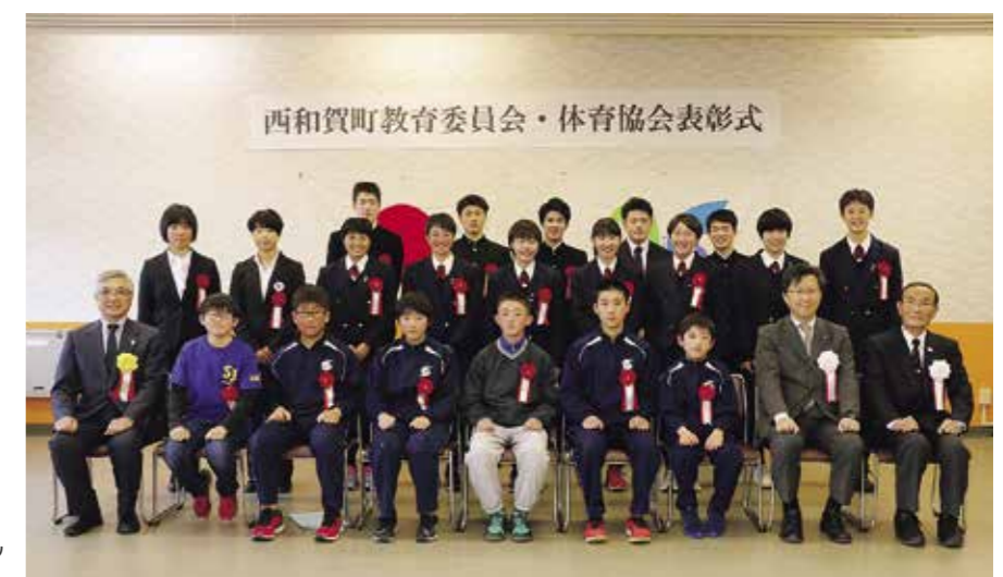
体育協会表彰を受賞した皆さん