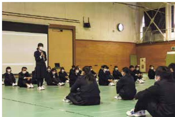
新入生は一人ひとり自己紹介をしました