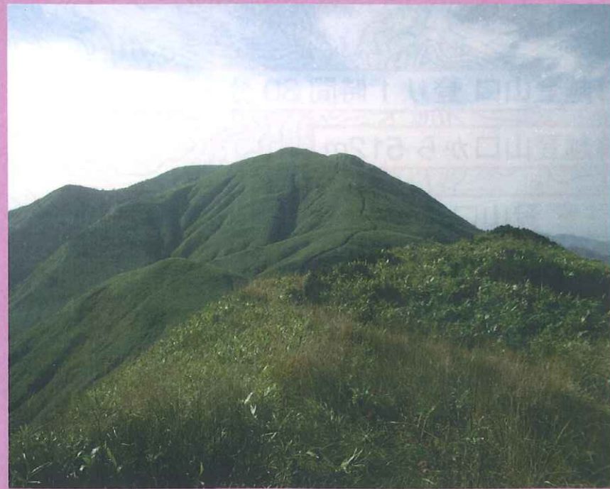
音動岳から真昼岳

真昼岳 1,059.9m 峰越登山口 (登り1時間30分 下り1時間) 兎平登山口 (登り2時間30分 下り2時間)