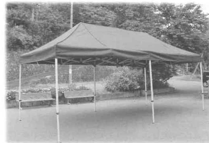
出番を待つテントの現在の様子(笑)

光寿会45周年を記念し、家族会からご寄贈賜りました。心より感謝致します。未だお年寄りにも、家族会の皆様にも、お披露目できておりません。早く使いたい一心であります！