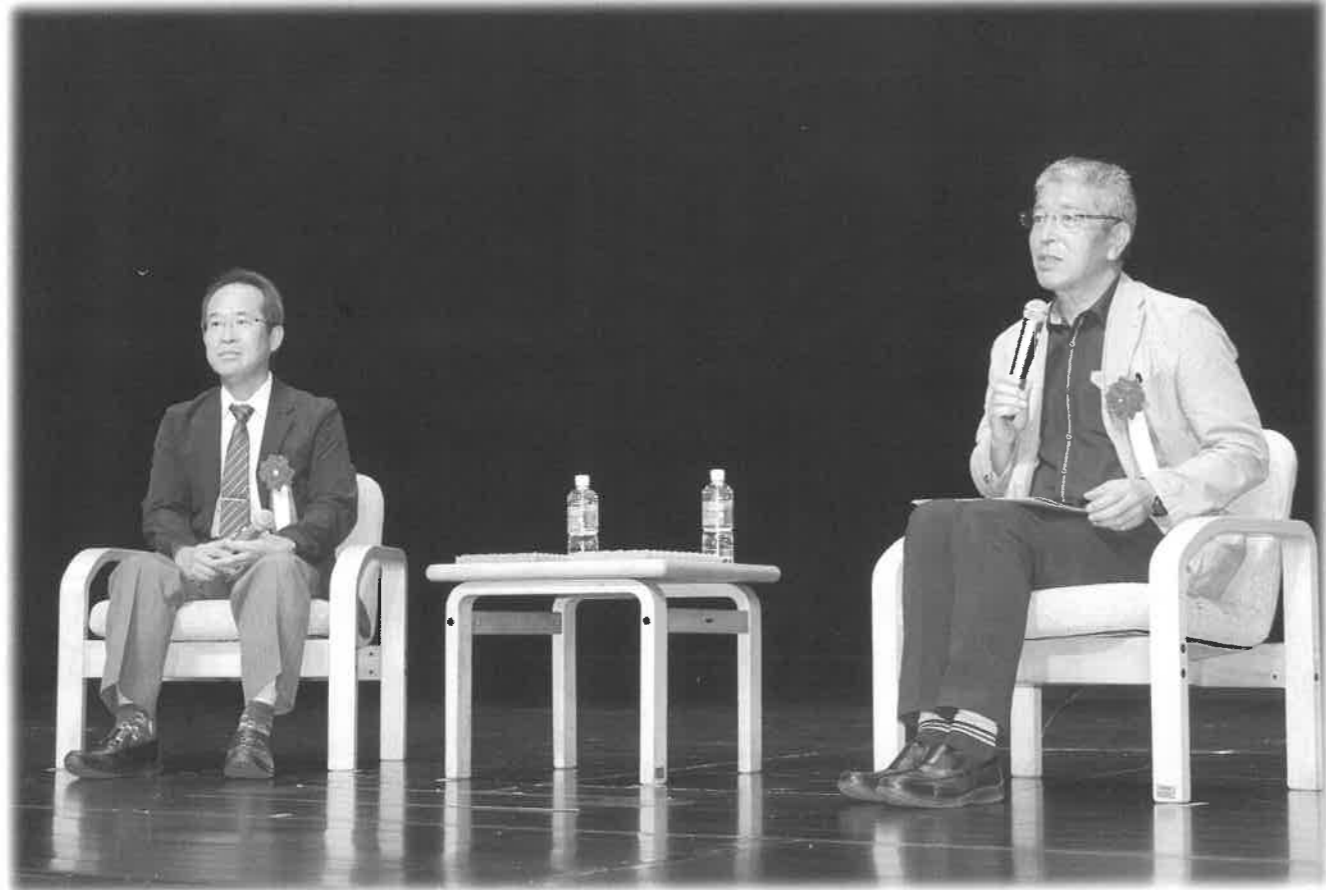
社会福祉法人光寿会創立45周年記念講演会 令和5年9月9日

発行 特別養護老人ホーム光寿苑 まんさく編集委員会 和賀郡西和賀町湯本30-76-1 TEL 0197-84-2526 koujhu@fancy.ocn.ne.jp 題字 元理事長 太田 祖 電