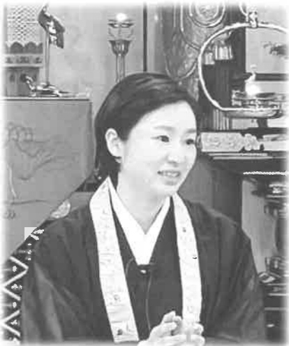
熱い語りで人気の琴先生

これまで祖電先生は、ご子息の急逝、ご自身の病い、奥様の死や震災；壮絶な出来事に遭遇されました。しかし、その折々で、そのご自身の身を通して、仏法の深いあいまいを玉蓮寺の門徒さんや私たち家族に伝え、苦難の中でお念仏申して生きていく姿勢をお示しくださりました。そして、自分に降りかかる悲しみ苦しみ大事に戴き、そこから歩み出す大切さも教えてくださったのでした。仏