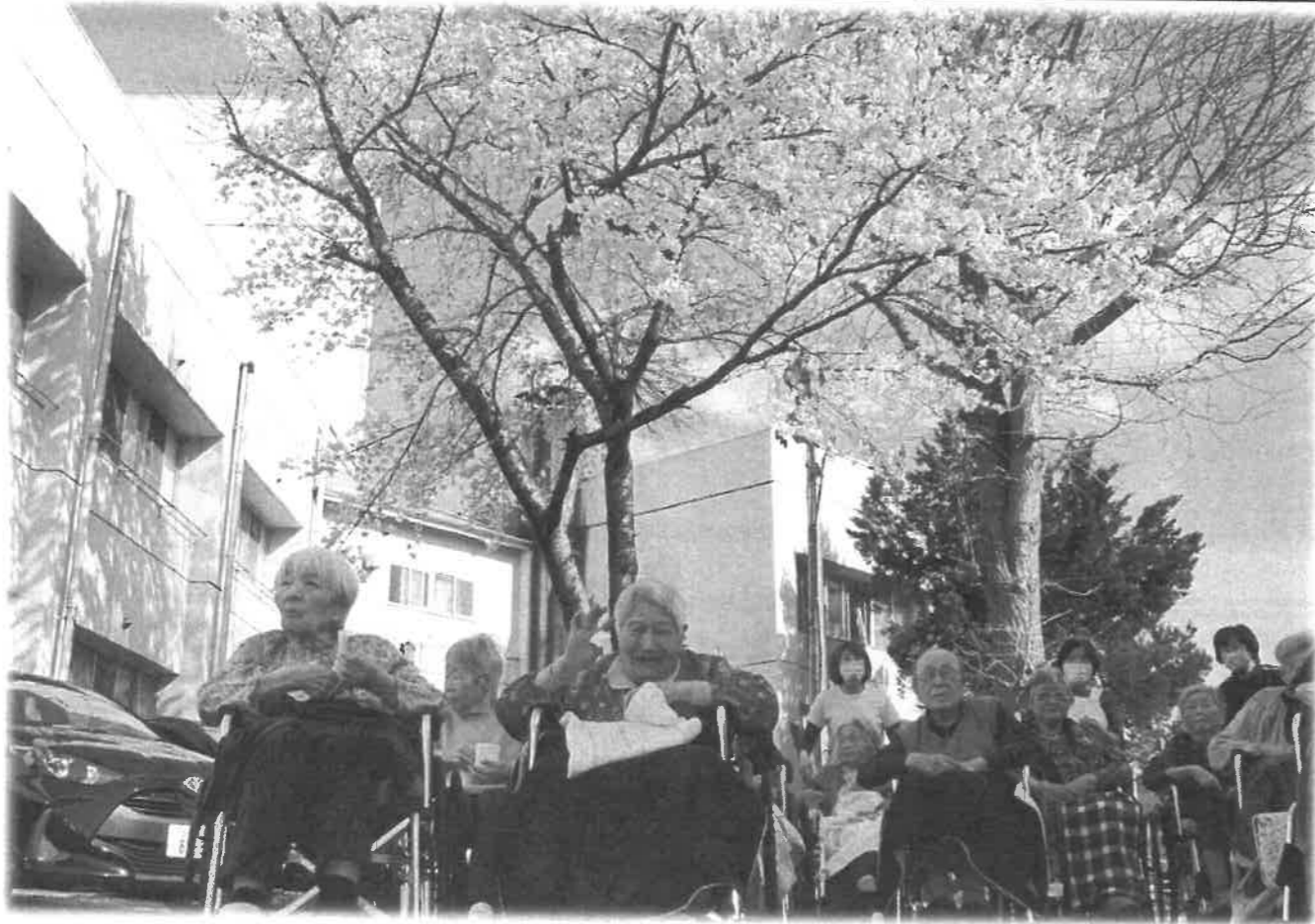
苑の庭でお花見 [令和5年4月]

発行 特別養護老人ホーム光寿苑 まんさく編集委員会 和賀郡西和賀町湯本30-76-1 TEL 0197-84-2526 koujhu@fancy.ocn.ne.jp 題字 元理事長 太田 祖 電