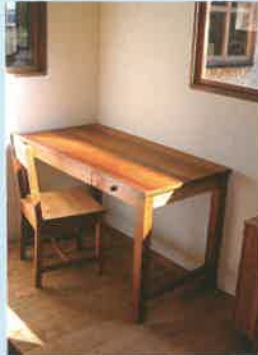
製品の詳細はホームページを要チェック