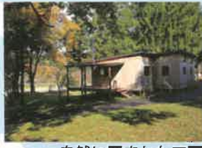
自然に囲まれた工房