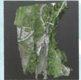
ドローン&地上レーザーによる点群データ(弁天島)