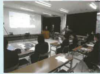
高校でのICT先進授業