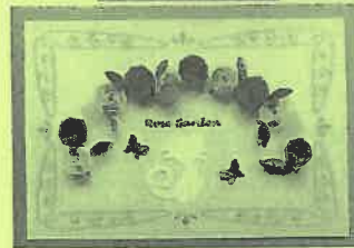
先生の作品 「ローズガーデン」

クイリングは、細長い紙テープをくるくる巻いてパーツを作り、そのパーツを組み合わせて作品を作るペーパークラフトです。