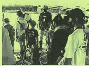
ろ過装置の説明を聞く様子