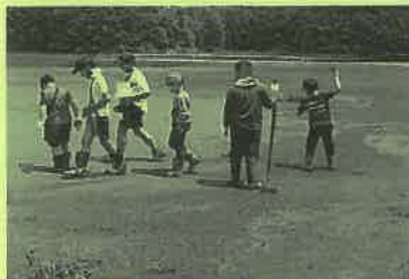
堆積場を歩く受講生

参加者からは「町内にこのような施設があったとは知らなかった」と驚きの声がありました。