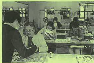
クイリングの様子

一般学習コースでは、9月に自主学習でのクイリング教室を開催することとしています。