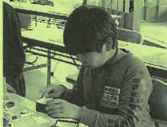
鉱物標本用の箱づくり