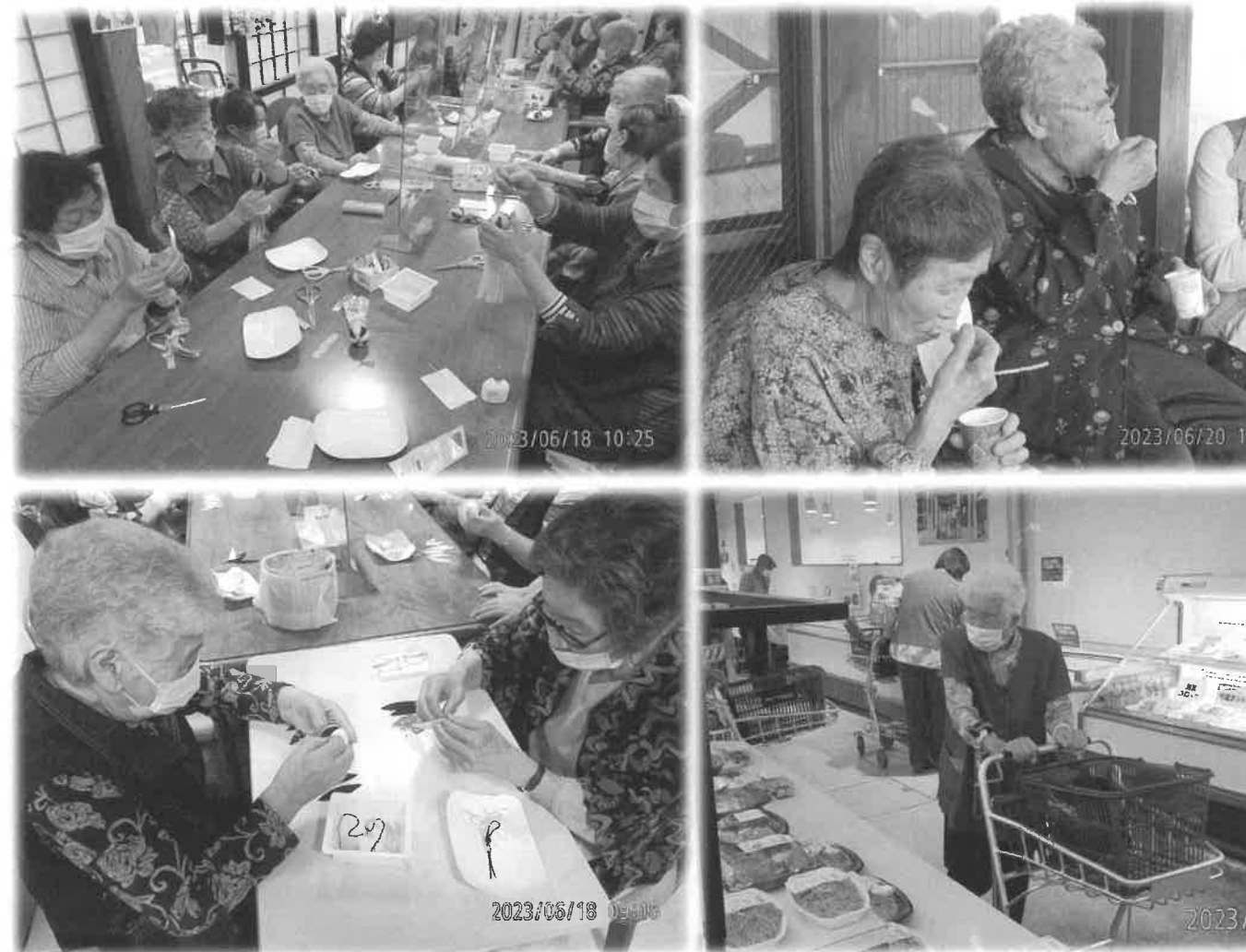
左2枚 お茶会「七夕吹流し作り」 右上 ドライブ寄り道中 右下 上野々地区サロン買い物ツアー