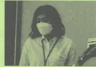
ドコモショップ北上中央店講師