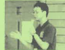
講師: 県南青少年の家職員

シャフルボードは、カーリングに似たスポーツで、コート反対側にある得点スペースに向かって