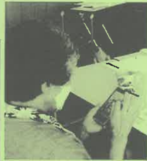
携帯を操作する参加者

「メルカリ」は、個人同士が商品を売り買いすることができるスマートフォンのアプリケーションで、毎月2千万人以上が利用する国内最大のフリーマーケット(市場)です。