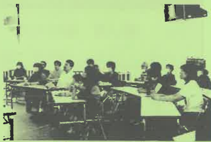
講演を聞く受講生

講演会には土畑鉱山に縁のある方やご家族の方、小学生と保護者の方などが参加しました。土畑鉱山は日本有数の鉄や銅の産出鉱山であったことがわかると、参加者からは「地元の鉱山のことを知ることができ、有意義な時間だった」といった感想が寄せられました。