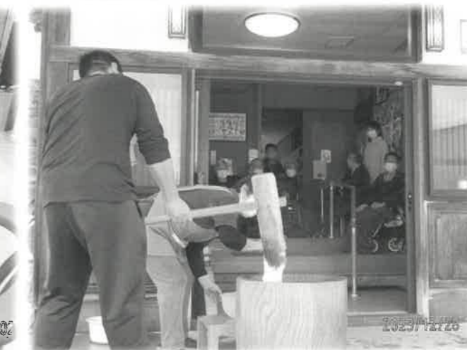
【左上】上野々サロン「クリスマス会」