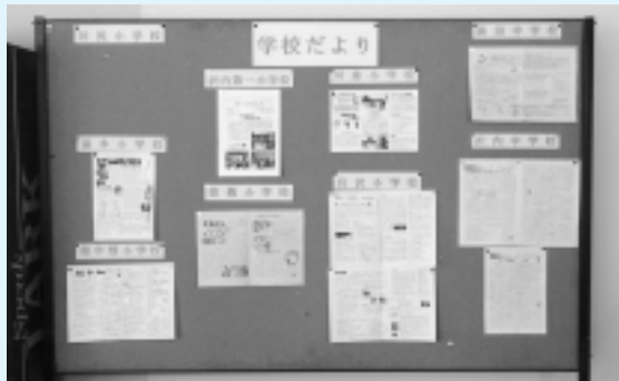
湯田庁舎町民室に掲示してある学校だより

湯田庁舎の玄関にあった現金自動預払機が撤去され、町内小学校の校報がはり出されました。聞けば、沢内庁舎にもコーナーを設