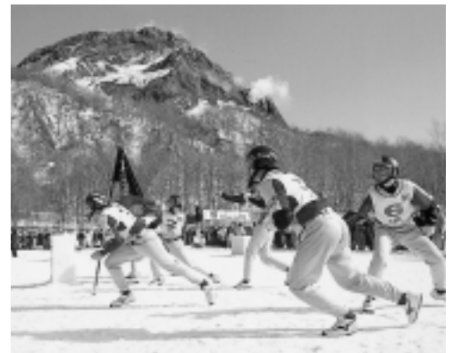
あと一歩で優勝を逃した西部レイダース

その結果、決勝トーナメント準決勝で西部レイダースが今大会優勝の「第N回優勝札幌チーム」（北海道）と対戦し、終始相手を圧倒していたもののあと一歩というところで惜し