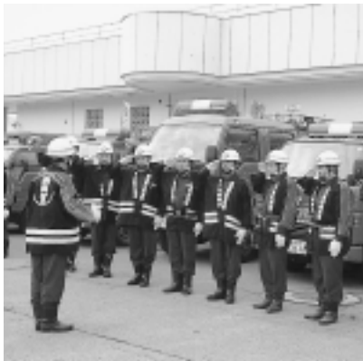
点検の指示を受ける団員

パレードでは、拡声器で避難口の確認や消火器の点検整備を住民にお願いしながら消火栓や防火槽などの点検を行いました。