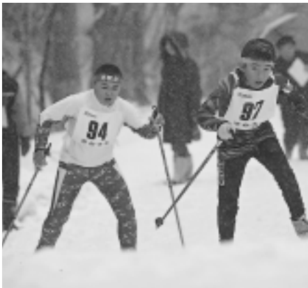
2日目はきびしい条件でのレースに なりました

この大会は、第1回大会は小中学 生の個人競技のみ、第2回大会から 小中学生のリレー競技が加わり、第 10回大会から高校生以上29歳までを 対象とする一般の部が加わりました。 平成13年の第7回大会からは30歳以 上の選手を対象とする「沢内クロス