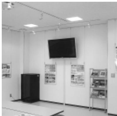
情報は今後も追加されます

展示室などのほかトイレも完備し、車いすでの利用も可能です。入場は無料で、開館時間は午前9時から午後4時30分までです。