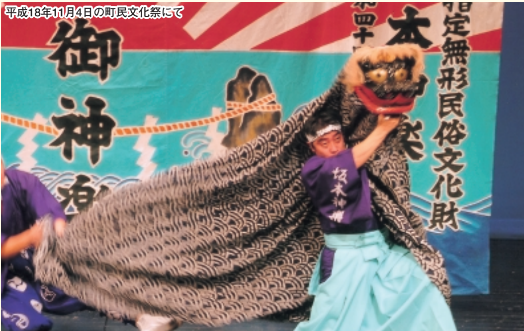
平成18年11月4日の町民文化祭にて