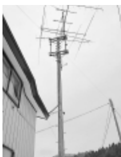
自慢の回転するアンテナ

仕事の関係で交信する時間がとれないが、もっと無線をやりたいね。そして、クラブを存続していくことです。