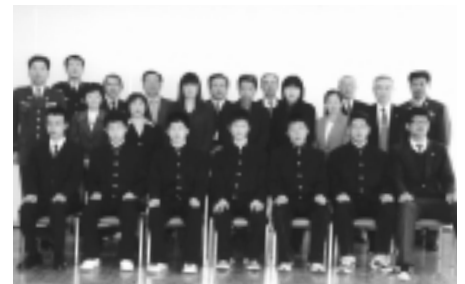
志を高くする入隊者(前列)

2月21日湯田庁舎で、保護者や自衛官募集相談員など関係者が見守る中、平成19年度自衛隊入隊者激励会が行われました。