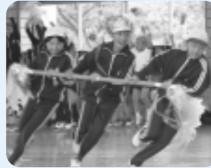
台風目の目になれ、吹き抜けろ