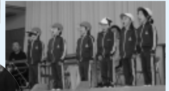
1年生による開会の言葉