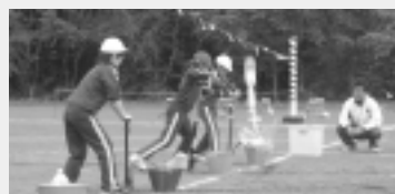
ペットボトルロケット発射!