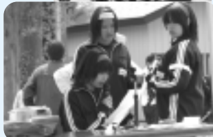
アナウンサーもごなします