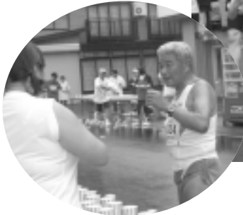
給水所で水分を補給