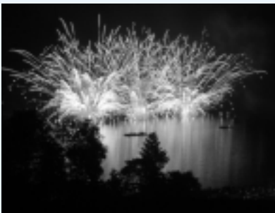
湖面に映る水上花火

5月30日と31日、恒例となつている錦秋湖湖水まつりと錦秋湖マラソンが行われました。