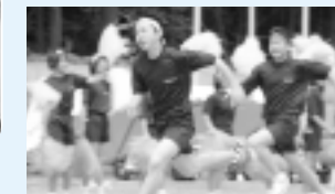
応援を受けながら駆け抜ける