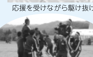
激突!男子団体の騎馬戦