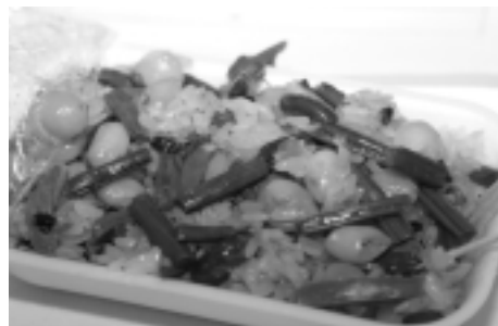
西和賀の特産わらびが入った炊き込みご飯です