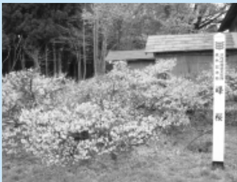
(西和賀町指定天然記念物)

峰桜は、北海道や本州中部以北に自生する桜で、本州では山間部の標高の高いところで見られます。