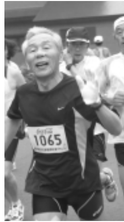
沿道の声援に手を振ります