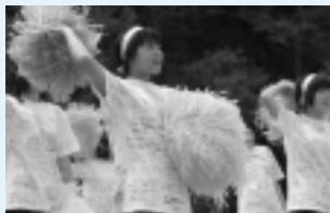
応援合戦。黄軍も赤軍も趣向を凝らした応援