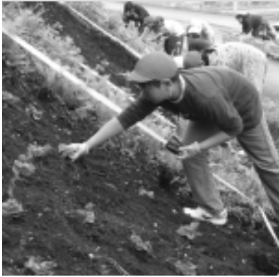
思いやりの心をこめて定植

最後に参加児童全員が「生まれればかりのやわらかいころに『人権』という名の種をまき、『思いやり』という名の水と『愛』という名の栄養をそそいであげよう」と誓いのことを斉唱しました。