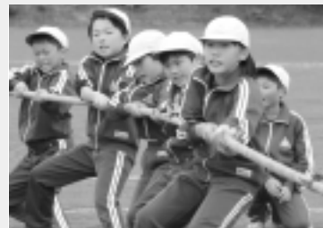
みんなの力を合わせて綱引き

貝沢小学校では5月30日に運動会を行いました。前日まで降り続いた雨から一転して天候にも恵まれ、地区の皆さんと一緒に競技を楽しみました。