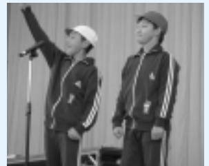
応援合戦を前に団長対決