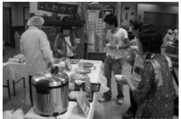
湯夢プラザでの試食会

町全体を市場ととらえ、訪れる皆さんに山菜を中心としたおもてなしをする「西和賀まるごと山菜市場」が、5月30日から6月14日にかけて行われました。市場に参加した旅館や飲食店、産直施設などにはのぼり旗が掲げられ、町内外でさまざまなイベントやおもてなしが繰り広げられました。