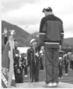
選手宣誓。 正々堂々と戦います