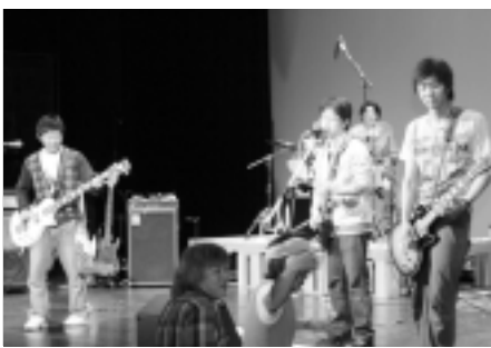
昨年12月「怒涛のクリスマスライブ」での演奏

西和賀は文化活動がとて盛んな土地だと思います。こんな恥ずかしがり屋の私たちでもステージに立つことで、人が集まってくれます。協力してくださる多くの皆さんに感謝しています。西和賀がますます活気のある町になるよう、若い力で盛り上げていきましょう!