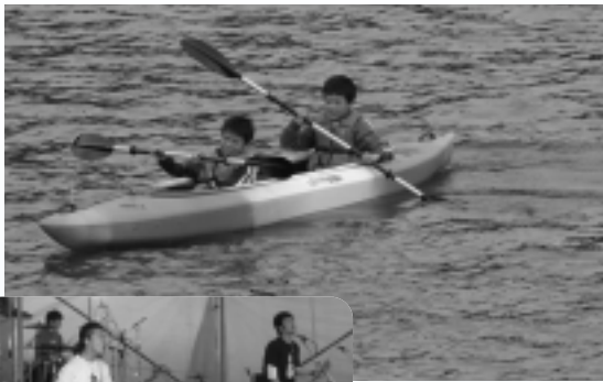
錦秋湖でカヌー教室