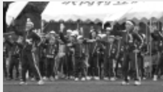
応援合戦・それいけ白組