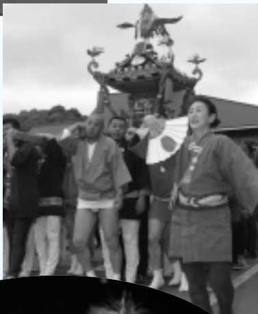
「セイヤ、セイヤ」と 威勢のこゝろ