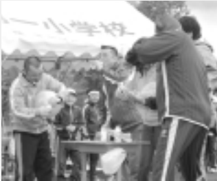
P T Aも迫力の競争を繰り広げます