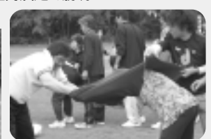
P T Aによる「Tシャツおくり」