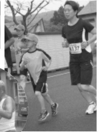
応援しながら いっしょに走ります