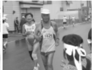
太鼓の応援に応えるランナー