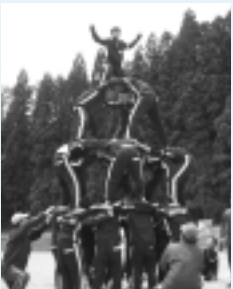
再挑戦の赤軍4段タワリ

沢内中学校の運動会は5月16日に行われました。勝ちにこだわった競技の結果は赤軍の勝利。黄軍の連覇をくい止めました。