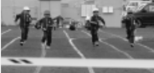
ゴール目指してまっすぐ走ろう