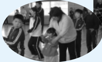
地区民も混じってさんさ踊り