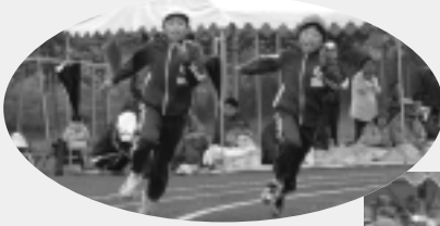
隣には負けたくない!

5月23日に行われた沢内第一小学校の運動会。後半は雨模様となりましたが、児童たちは雨にも負けず元気に競技を続けました。