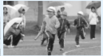
小雨の中元気によく駆け抜けます

湯本小学校では5月17日に運動会が行われました。天候が思わしくなく、トラック競技以外は体育館に場所を移して行われました。