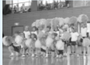
リズム体操でキメポーズ