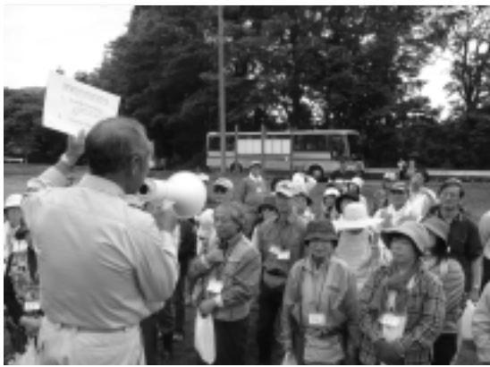
ワラビ採りの説明を受ける参加者

ツアーには盛岡市を中心に83人が参加し、2コースに分かれて町内を散策しました。Aコースは湯川沼の自然観察、湯夢プラザでの昼食、Bコースは安ヶ沢の自然観察、ワークステーション湯田沢内での昼食というコースでしたが、