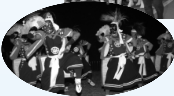
湯本鬼剣舞の勇ましい舞