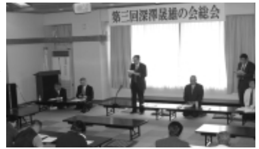
総会では資料館整備の決算を承認