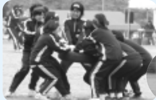
根性をみせた女子団体タイヤ引き