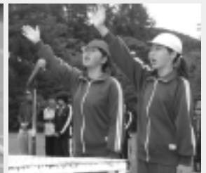
元気のよい宣誓で競技開始