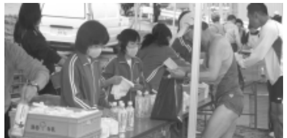
大会を支えるボランティアの活躍

5月31日には第29回河 北新報錦秋湖マラソン大会 が行われました。今回のマ ラソンには全国から238 6人の参加申し込みがあ り、当日は2182人のラ ンナーが、新緑に囲まれた錦 秋湖畔を駆け抜けました。 午前9時50分に、西和 賀町消防団ラッパ隊が行進 曲で登場。スタートが間近 であることを知らせます。 午前10時、ラッパ隊の ファンファーレとともに、 湯田庁舎前の交差点から 30キロ（太田で折り返し） とハーフ（新町で折り返し） の選手がスタート。5分後 には10キロ（湯本小学校 で折り返し）の選手がスタ ートしました。 スタートとほぼ同時に降 り出した雨の中を、沿道の 声援を受けながら駆け抜け た選手たち。ゴールではユ ニフォームがびしょ濡れに なりながらも、満足そうな 顔を見せていました。 このマラソン大会は50 0人をこえるボランティア によって支えられています。 町消防団をはじめ、地 元住民や湯田中学生も協力 し、大会運営で活躍を見せ ました。