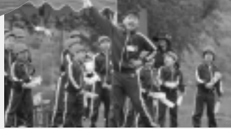
応援合戦・がんばれ赤組