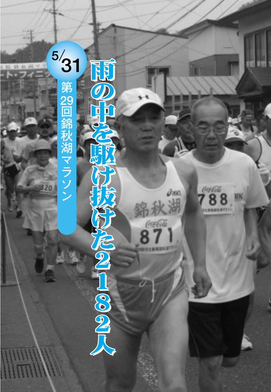
10キロの部のスタート