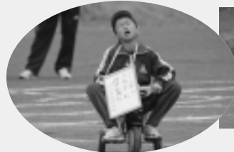
これは厳しい条件!借り物競争