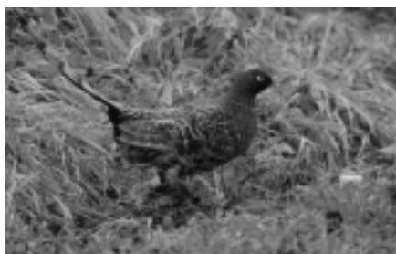
町の鳥・ヤマドリ