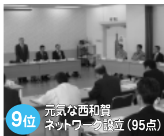
町の産業を活性化させるためのアクションプログラム推進組織として「元氣な西和賀ネットワーク」が設立しました。