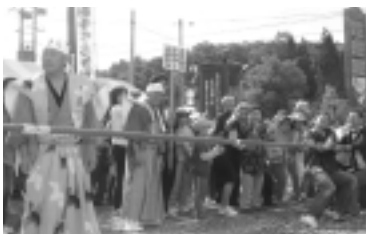
10月に行われた「国取り合戦」

主防災組織も立ち上げ、8月にAED操作を含む救命救急、消火器・消火栓からの放水訓練を行っています。