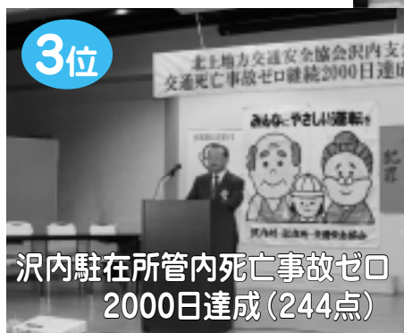
◀ 沢内駐在所管内で交通死亡事故ゼロ継続日数が2月16日に2000日を達成。現在も継続中で、12月13日に2300日を達成しています。