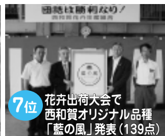
7月15日に行われた西和賀花卉出荷大会で、西和賀オリジナル品種の「藍の風」が発表されました。