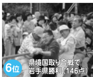
10月4日に行われた県境国取り合戦。ユニークな競技が続ぎ、最終戦の綱引き大会で岩手県が勝利をおさめました。