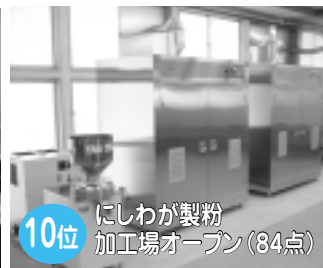
旧左草保育所の建物を改装し、農林産物を乾燥・製粉する施設「にしわが製粉加工場」がオープンしました。