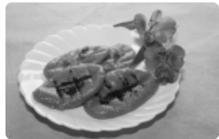
蒸し器にクッキングシートを敷くとくっつきにくくなります