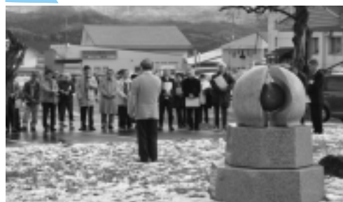
「いのちの灯」前で生命尊重の精神を新たに

昭和58年、太田の沢内病院前に建立された「いのちの灯」記念碑。老人医療費無料診療発祥の地をたてるため、全国各地からの寄付で建立された碑は、両手で小さな命を包んで守っている姿を表し、正面には「永遠にいのちの灯を」と刻まれています。