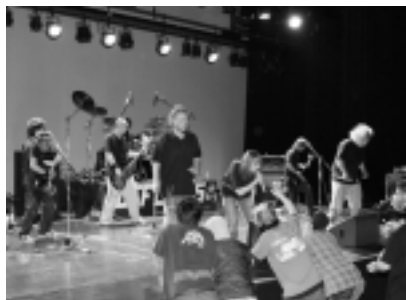
クリスマスライブでの演奏