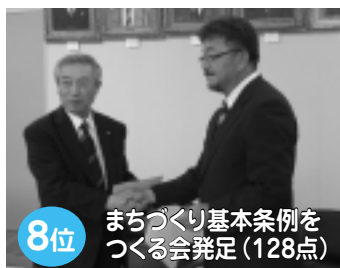
一般からの応募者12人を含む16人で「西和賀町まちづくり基本条例をつくる会」が発足。町民主体で条例案策定に向け活動しています。