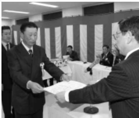
長年努力してきた皆さんを表彰

岩手県商工会連合会長表彰や西和賀町長表彰、商工会長表彰などあわせて22人を表彰したほか、町内事業所に就職した新規学卒就職者7人にも、今後の活躍を期待し記念品が贈られました。