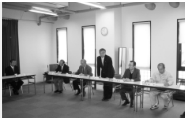
12月3日に行われた総会のようす

総会では、21年度事業の中間報告が行われ、目標としてきた「集客・宿泊者数5万人増」と「西和賀産業公社管理施設の売上20%増」(いずれも20年度比)に対して、一定の成果があったことが報告されました。