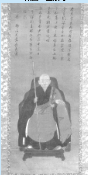
(西和賀町指定有形文化財)

肖像画のことで、古来からこのように絵は、師匠から法を授けられた弟子だけがその証として師匠の頂相を描くことが許されたといわれています。師匠の「自賛」の表現として後世に