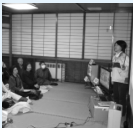
デジサポ岩手の説明会のようす