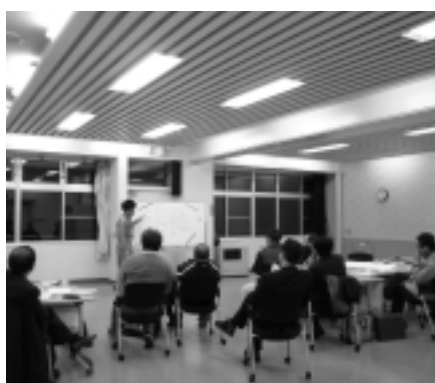
班ごとの話し合いの結果を全体で発表しているようす

次回は住民参加などをテーマに話しあう予定です。つくる会の会議は傍聴することができ、お気軽に会場にお越しください。日程などについては、お問合せいただくか、町ホームページでご確認ください。