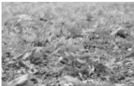
町の花・カタクリ