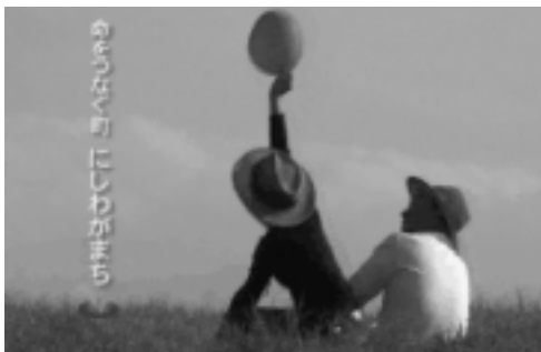
「命をつないで」のひとコマ

12月6日、岩手朝日テレビが行う「ふるさとCM大賞in I W A T E 2009」の審査会が盛岡市のアイーナ（いわて県民情報交流セ