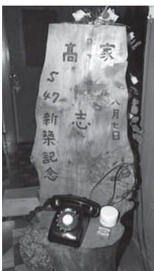
▲自宅の電話台は新築記念の作品

最近ではなかなか良い材料が見つからないのが大変です。作業としては、材料の板の大きさや形に合った文字割りをするのが難しいですね。