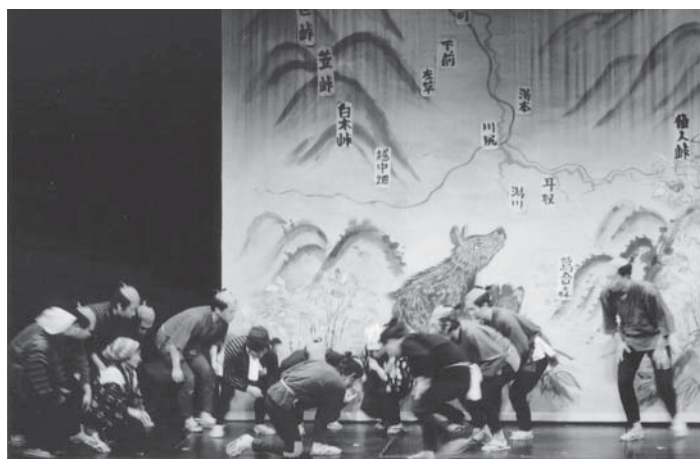
銀河ホール開館10周年記念、湯田沢内町村民交流劇場「年代記を綴る人々」の舞台より（平成14年12月）