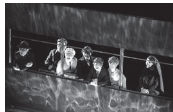
◀「銀河鉄道」に乗り不思議な旅を続けます