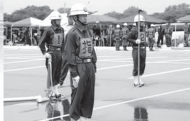
小型ポンプの部準優勝の6分団3部

第40回目を迎えた（財）岩手県消防協会北上地区支部消防操法競技会が、7月3日に北上市の展勝地第2駐車場を会場に行われました。 この競技会は消防団員の技術向上を目的に隔年で行われているものです。今回は西和賀町からポンプ車の部2隊と小型ポンプの部3隊、北上市からはそれぞれ4隊ずつの合計13隊が出場しました。いずれの部隊も市や町の競技会で上位に入賞した精鋭です。 競技ではポンプからホースを展長し、放水で火点（標的）を倒すまでの速さ、撤収するまでの行動の正確