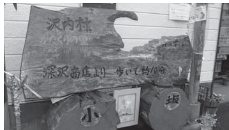
▲カタクリ群生地入り口の看板

作る機会と良い材料があれば、これからも長く続けて自分の楽しみにしていきたいです。