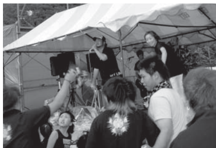
盛り上がりを見せた「OFFLIMITS」の演奏

7月10日、川尻の錦秋湖グラウンド駐車場特設会場で、野外音楽イベント『GREEN MOUNTAIN -MADE IN 音楽-』が行われました。