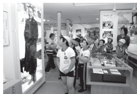
「生命尊重」の精神に触れた児童たち

社会科の授業の一環で町内施設の見学を行ったこの日、児童たちは他にも役場沢内庁舎や碧祥寺博物館なども見学。自らが住む町のことを勉強しました。