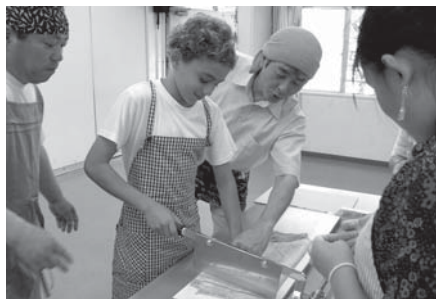
うまく切るのは難しそう

6月28日から7月1日にかけて、アメリカメリーランド州ベゼスタのパイル中学校の生徒10人と引率教師2人が、西和賀町を訪れました。