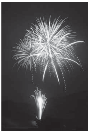
▲平成20年8月の花火大会

また長瀬野地区では、福祉の向上を目指すため盛岡市のみちのくみどり学園の子どもたちと一緒にホームステイを行っています。首都圏などの児童養護施設の子どもたちが参加する「全国・西和賀まるごと児童養護施設事業」も7年前から行っています。