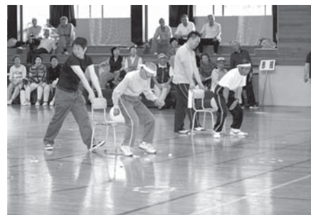
なかなか割れない風船「血圧レース」