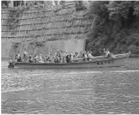
試運行はあと数回行う予定です