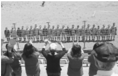
対釜石戦

い野球で5点差をひっくり返す逆転劇で勝利しました。2回戦の相手は、昨年の県大会優勝校の盛岡中央高校で、1点を先取したものの残念ながらその後5点を取られて逆転負けしました。盛岡中央高校に勝てば、夏の選手権岩手大会のシード権（優待出場枠のこと）で、1回戦は不戦勝になりました。すを獲得できただけに惜しい結果となりました。