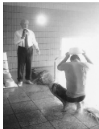
前回の温泉入浴法の指導の様子

ルや屋内体育施設、ハイキングコースを活用した運動療法などを組み合わせ、専門家が作成した療養プログラムで一泊二日の集中講座です。