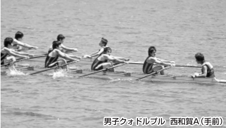
男子クォドルプル 西和賀A(手前)