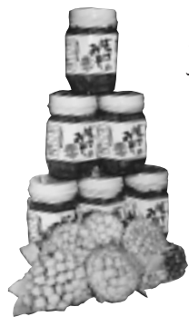
自慢のばっけみそ

いろいろな試してきました よ。でも「これもだめだ」 「あれもだめだ」としほり こんで、今のところは「フ キノトウのつくだけ煮」や