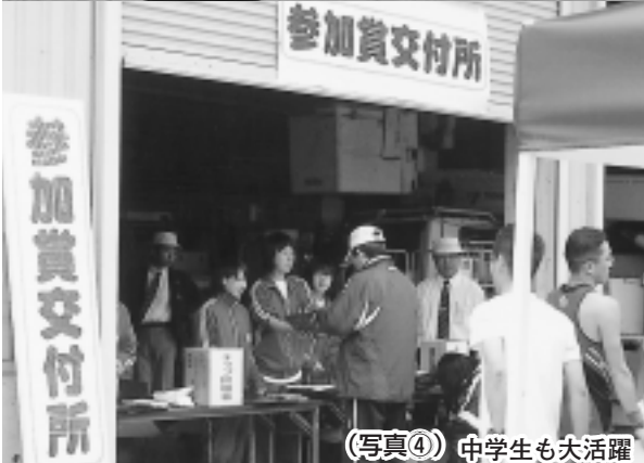
(写真④) 中学生も大活躍

5月27日第27回河北新報錦秋湖マラソン大会が行われ、全国各地から1811人のランナーが新緑映える錦秋湖湖畔を駆け抜けました。