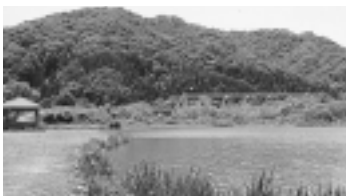
人気の廻戸つり公園

てタイミングよく釣ります」。そのため、うまいか、下手かはすぐわかると言います。続けて「これだけきれいな釣り堀はないと、町外の愛好者からほめられます。いいところには人が集まります。会員も昔と比べると減っていますが、今後も活動を継続していきたい」とし、「初めての人でも、興味があればつり公園に寄ってほしい」と話していました。