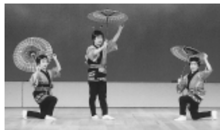
ことし3月、県の発表会の様子

県の発表会は2年に一度で、ことしの3月で した。今度のは、文化祭にむけて会員4人で出演 できるようにまいぐる練習 張っていた曲を覚えま す。1年をペースして