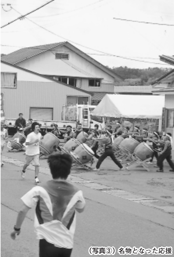
(写真③) 名物となった応援