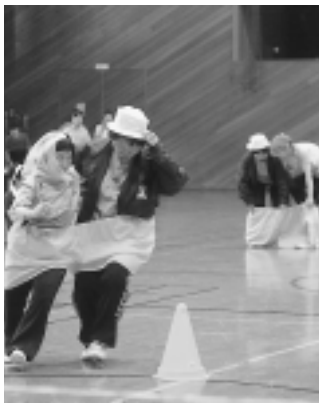
仲良く手をつないでゴール

チーム編成は受付順に3チームに分かれての対抗戦となりました。「知恵を出し合って決めたい」という競技種目では、ハッスルプレーに笑いありと楽しい交流の日となりました。