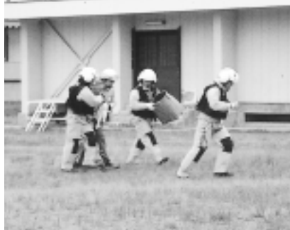
平成15年の防災ヘリによる救助（西高グラウンド）

平成18年警察白書によると、平成17年には、全国で山菜採りや登山で遭難した山岳遭難は、1400件あまり発生しています。このうち300人あまりが行方不明や遺体で発見されます。県内では平成17年中に、山岳遭難は45件発生し、61人が遭難しました。このうち9人が死亡し、24人が重軽傷を負っています。また45件中、山菜採りに伴う事故は9件で、死者2人、負傷者2人を出しています。実に遭遇したおよそ2割