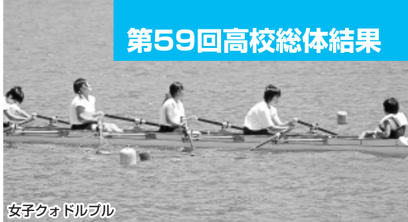
女子クォドルプル