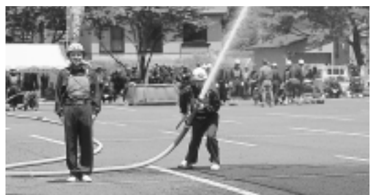
的をめがけて放水

6月17日錦秋湖グラウンド脇の駐車場で、第2回西和賀町消防操法競技会が行われました。