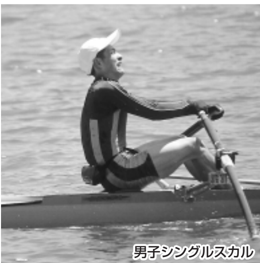
男子シングルスカル

5月23日に県営運動公園陸上競技場で総合開会式が行われ、水泳競技(6月末)を除く31種目の第59回岩手県高校総合体育大会の幕が開きました。このうちボート競技は錦秋湖を主会場に6月1日から3日までの日程で行われました。