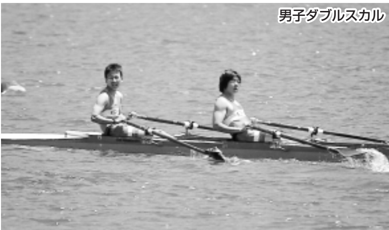
男子ダブルスカル