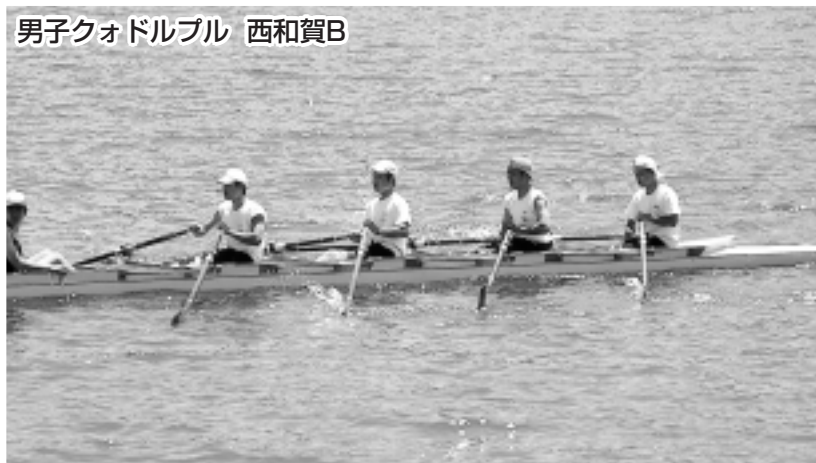
男子クォドルプル 西和賀B