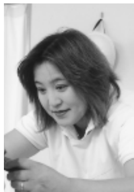
恵子さんの散髪は大人気です