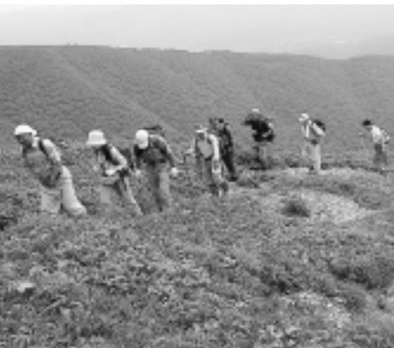
「天気が良くて気分は最高!!」