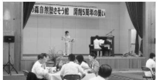
コンサートでは校歌を口ずさむ声も

左草小学校が湯本小学校に統合したのが平成13年3月。廃校となった左草小学校の活用が検討され、平成14年7月8日、人・自然・文化にふれあう体験施設として「ブナの森自然塾さそう館」として開館しました。