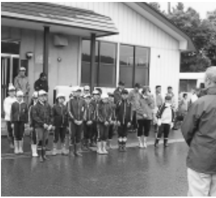
下前公民館前の出発式の様子

三滝とは、白糸の滝、降る滝、姥滝の3つを指します。地区では古くからこの水源一体を信仰の対象にし7月3日を例大祭日としており、現在もそのなごりで毎年参拝を行っています。