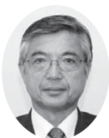
町長 細井 洋行