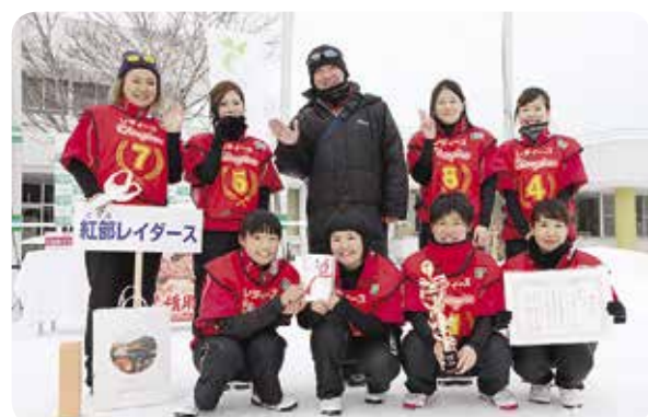
レディースの部優勝「紅部レイダース(西和賀町)」