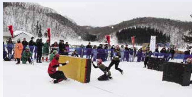
レディースの部決勝戦