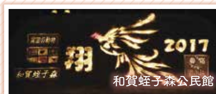
和賀蛭子森公民館