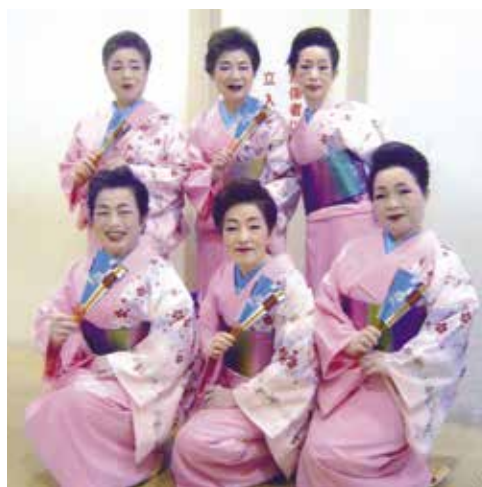
ボランティア活動を行っています。 仲間とのスナップ写真です。 前列右本人

しさと嬉しさに心がときめきます。年に数回、関東在住の仲間や友人と沢内ふるさと会や川舟ふるさと会で会う機会があり、旧交を温めています。その時に話題に上るのは、近況の他は故郷での思い出話、お開きになる頃はみんなお国言葉が蘇ってしまうほど楽しい時を過ごします。故郷を離れる寂しさは一樣ですが、故郷を思う心もまた同じようなものがあるのでしょうか。これからも仲間と会うこと、そして故郷からの便りを楽しみにしながら、日々を送っていきたいと思います。