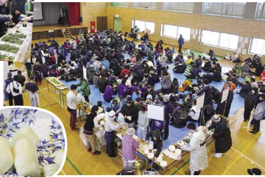
多くの参加者で盛り上がった交流会