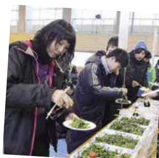
西わらび、大根の一本漬け、納豆汁など地元料理のお振る舞い