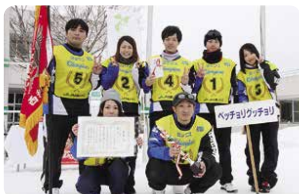
ミックスの部優勝「ベッチョリグッチョリ(遠野市)」