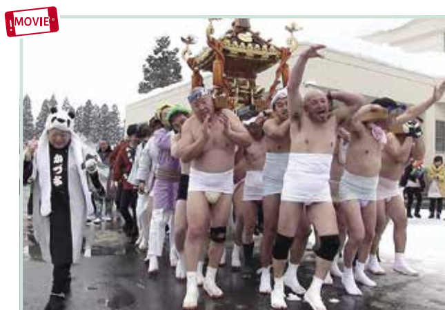
威勢のいいかけ声で練り歩く神輿