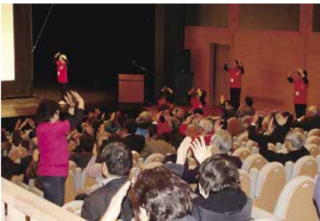
参加者と一緒にシルバーリハビリ体操を行ないました

町が主催するこの「まつり」は、健康づくりや介護予防の輪を上げ、健康的な暮らしが定着していくことを目的に開催されたもので、会場には町内外から約150人の観客が訪れました。