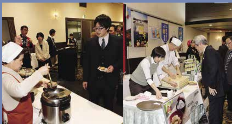
大好評の納豆汁や西わらび餅などの郷土料理

会場では、納豆汁やビスケットの天ぷら、西わらび餅などの定番料理や町の食材を使用した創作料理、西わらび餅や銀河高原ビール、湯田牛乳など町の特産品が提供され、参加者を魅了しました。