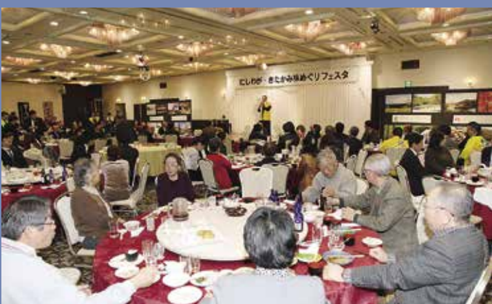
会場は多くの参加者で賑わいました

2月8日、ホテル東日本盛岡を会場に10回目となる「にしわが・きたかみ味めぐりフェスタ」が開催されました。このイベントは町観光物産推進協議会などが主催し、特産品や食文化を発信と観光客の誘客や販路拡大を目的に行っているもので、当日は約160人の参加者が集まりました。