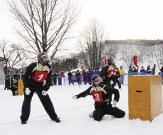
一般の部準優勝クルス

今大会の結果により、一般の部とレディースの部の上位チームが、2月25日～26日に北海道壮瞥町で開催された第29回昭和新山国際雪合戦に出場したほか、3月4日～5日に長野県白馬村で開催される第4回日本雪合戦選手権大会に出場します。