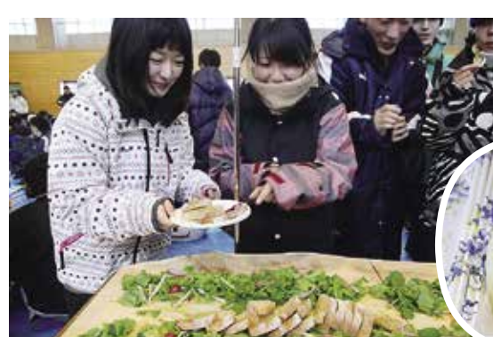
大好評の山岳工房 Korva のパン