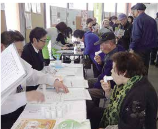
昨年齢を測定する参加者

また、人間ドックに関するデータなどのパネル展示や各種測定、診断などの健康チェックコーナーも開設され、参加者の健康意識を高めました。