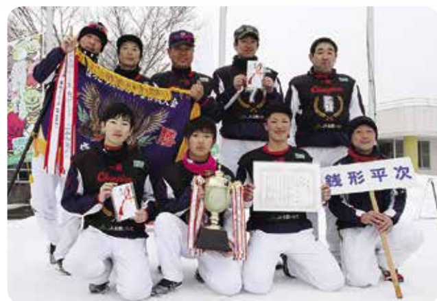
一般の部優勝「銭形平次(紫波町)」