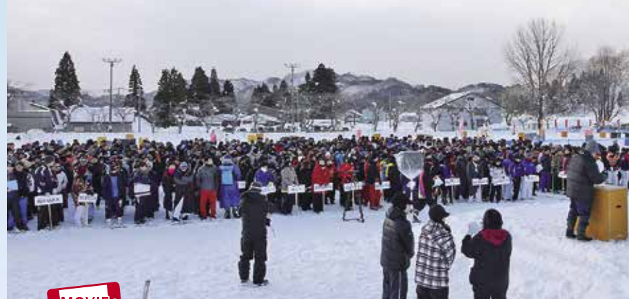
93チームが集結した開会式