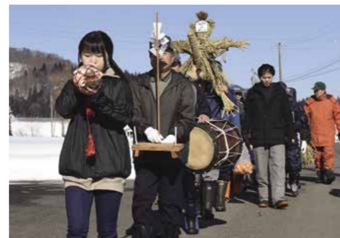
わら人形を担ぎ、地区内を練り歩く白木野地区の皆さん