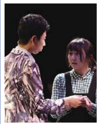
銀河ホール演劇部公演