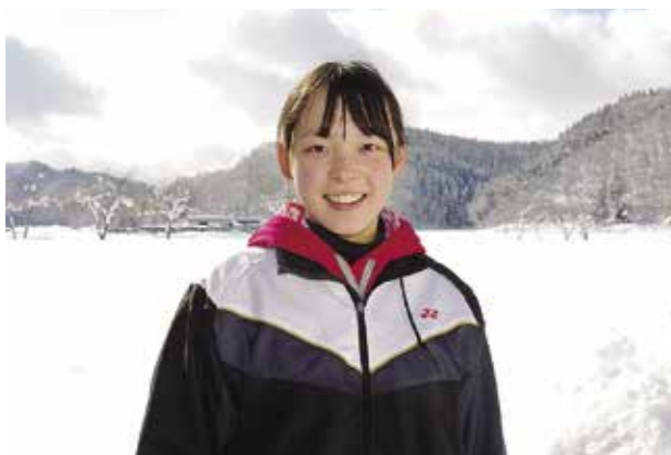
卒業後は看護学校へ進学し、夢を追いかけます