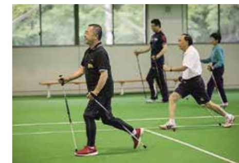
ポールウォーキングは2本のポール(杖)を持って歩く全身運動です

日日学部:エプロン、三角巾 ※参加希望者は3月12日(木)までに健康福祉課に申し込んでください 夜間学部:飲み物、タオル、上履き、動きやすい服装