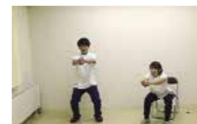
前で手を組み、3回スクワット。腰を下ろすとき、膝がつま先より前にならないことがポイントです