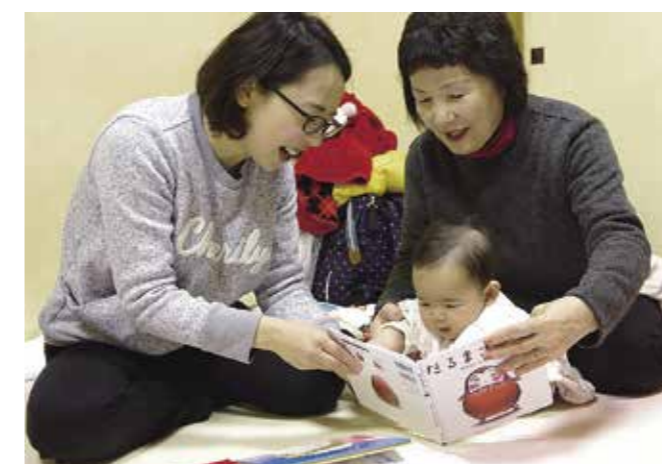
絵本に興味津々の赤ちゃん