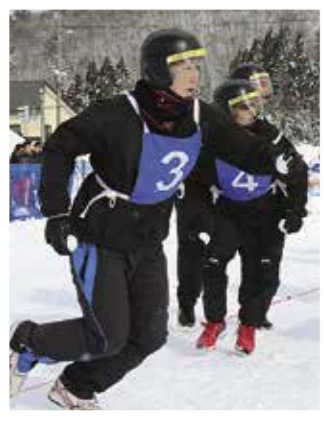
ほっとゆだ北日本雪合戦大会

●急患を除き、診療は予約制です。 予約は平日の午後1時～5時まで に電話をしてください。 ●時間を表示している診療科以外 の診療時間は、午前中のみです。 【夜間、土曜・日曜・祝日は救急・ 急患対応します】 問い合わせ先 ☎ 0197-85-3131