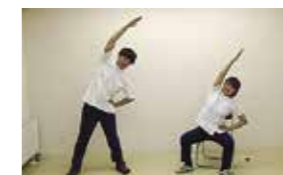
腰に手を当てて、足を肩幅に開き、腕を斜め上に伸ばします(反対側も同様です)

ひかり放送で体操しよう 1月6日から、平日の午前10時に西和賀ご当地体操をひかり放送で流します。午後3時のラジオ体操と併せて、健幸づくりにご活用ください。