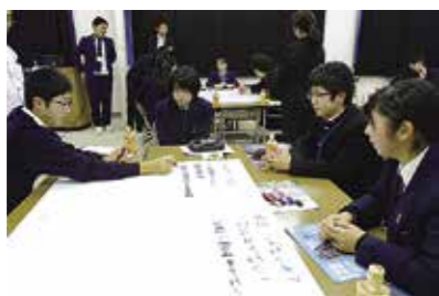
生徒を確保するための 意見交換をしました

小規模校の魅力づくりの充実を目指し、県内初の「高校生による小規模校サミット」を11月22日・23日に開催しました。大野高、住田高、宮古北高、西和賀高の代表生徒と町内中学生など約30人が参加し、意見を交換しました。