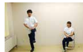
足踏みと片足立ち。転倒予防や姿勢を保つ動作です。片足立ちでふらつく人は足踏みだけでもOK

町は、西和賀町独自の「ご当地体操」の普及に努めています。曲は「三百六十五歩のマーチ」を基本に、テンポをゆっくりにし、町の特色を盛り込んだ替え歌です。肩こり予防や腰痛予防に効果があるほか、足踏みが多く歩数を確保することができ、外を歩く機会が減るこの時期だからこそ、日頃の生活に取り入れましょう。次のとおり、体操の実技指導を実施します。お誘い合わせの上、参加してください。出前講座も随時受け付けます。