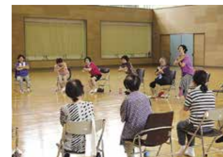
椅子ヨガは、少しの動きで肩こりを解消できる体操です